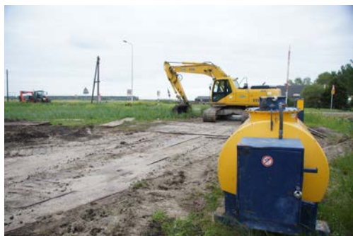
Die diefstal van brandstof van onbeveiligde opstelplaatsen is één van de grootste schadeposten voor bedrijven.