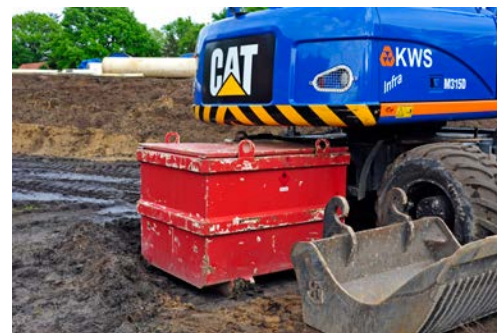
...of hier door de IBC tegen de machine en onder het contragewicht te plaatsen. De diesel in de opslag is in elk geval onbereikbaar.