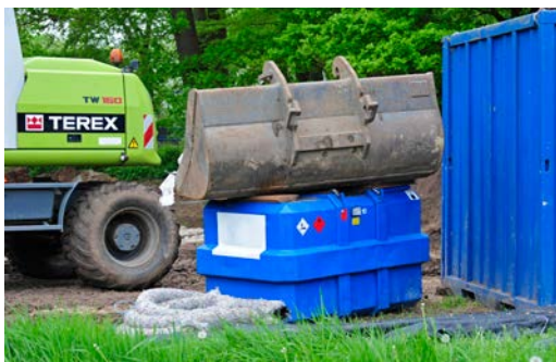
Om diefstal tegen te gaan, wordt vooral de IBC afgeschermd, zoals hier door er een bak op te leggen...